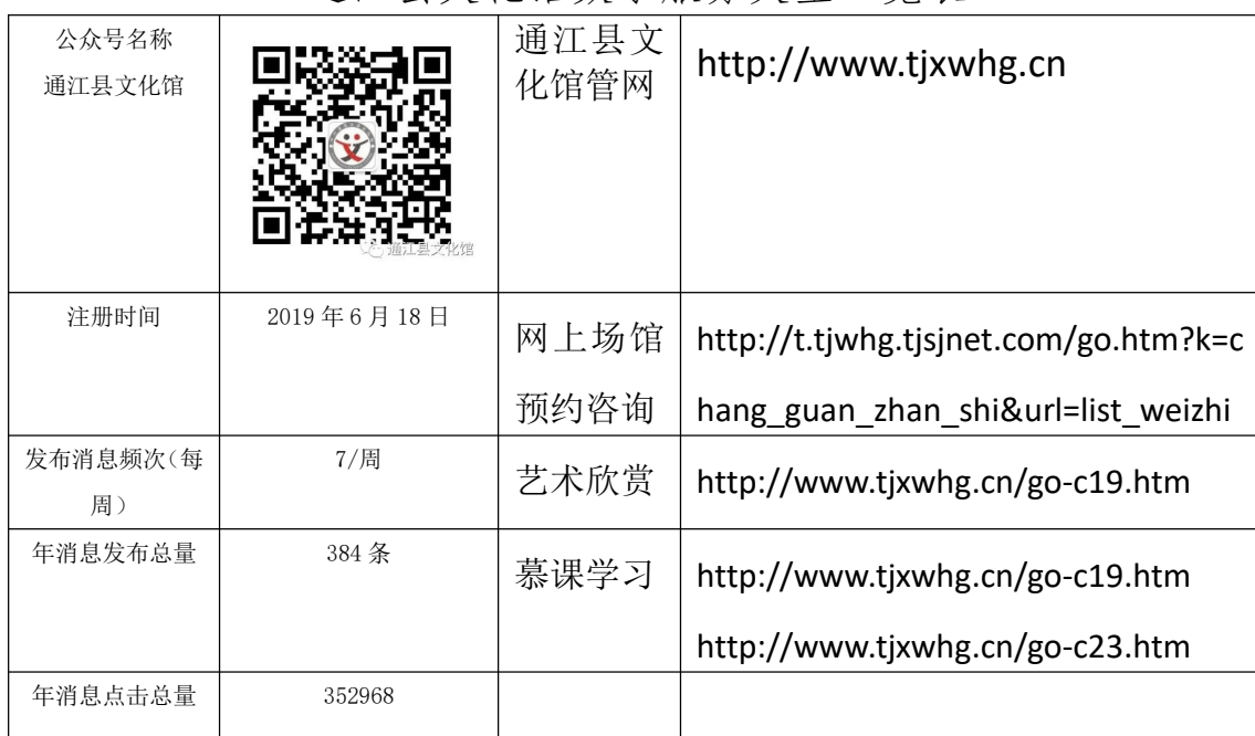
通江县文化馆数字服务类型一览表

通江县文化馆网址： http://www.tjxwhg.cn ，通江县文化馆微信公众号。网站具备信息发布、艺术欣赏（含视频点播）、网上培训、活动开展、基层文化、通江文艺、咨询指导等功能。2019年6月，注册了微信公众号，年访问总量达264716次。详细情况见下表：